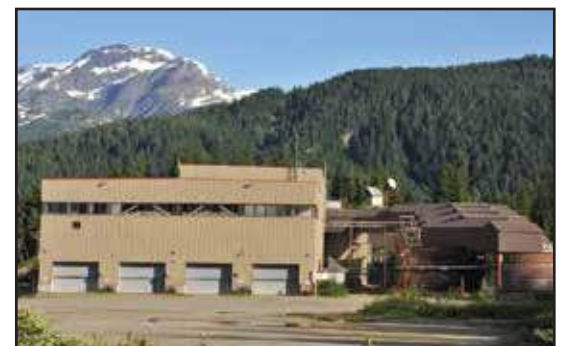
位于Premier项目的加工厂